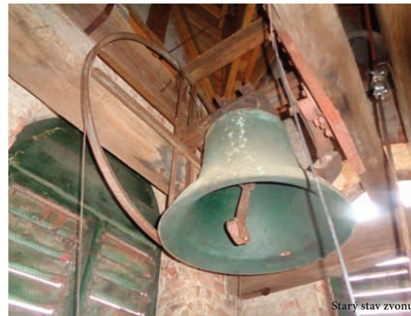
Starý stav zvonu