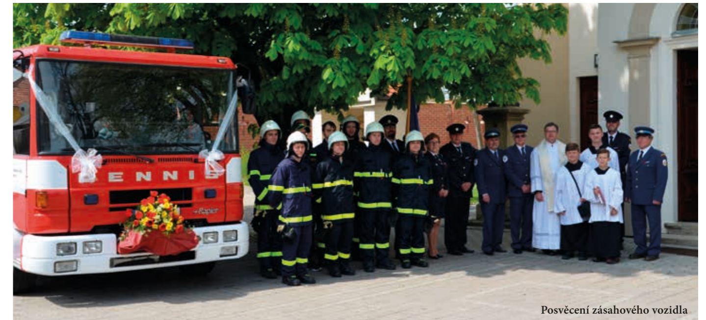
Posvěcení zásahového vozidla