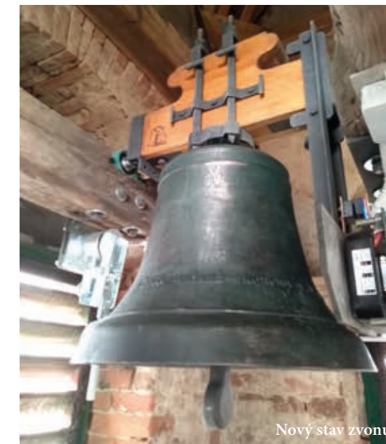
Nový stav zvonu