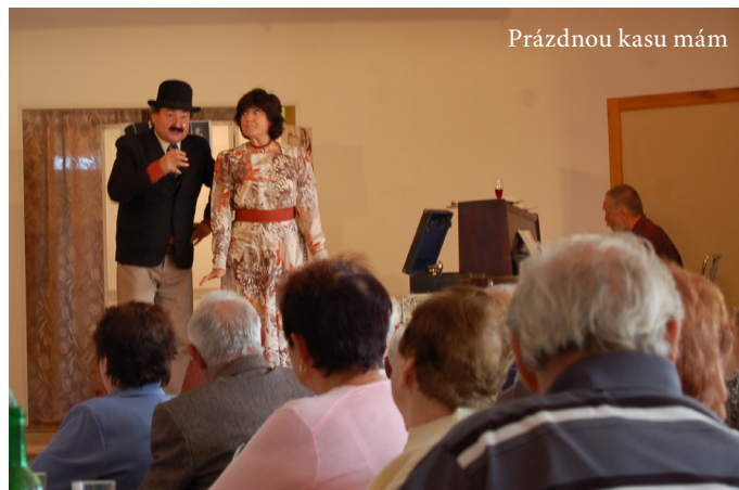
Prázdnou kasu mám