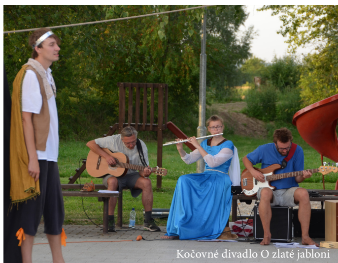
Kočovné divadlo O zlaté jabloni