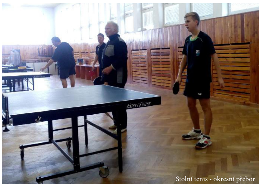
Stolní tenis - okresní přebor