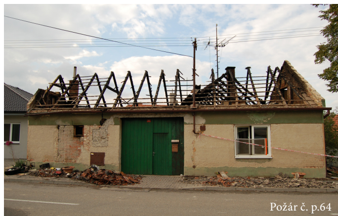
Požár č. p.64