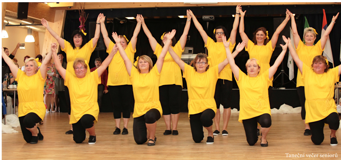
Taneční večer seniorů