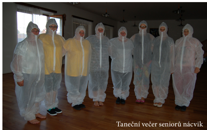
Taneční večer seniorů nácvič