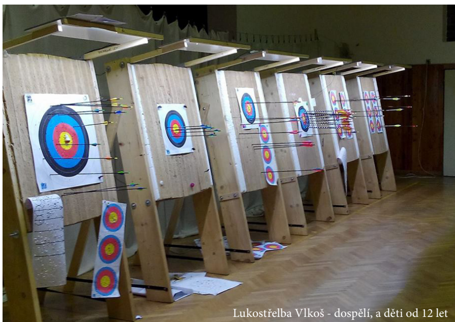
Lukostřelba Vlkoš - dospělí, a děti od 12 let

zimní část soutěže okresního přeboru v početně silném zastoupení. Chuť dorostenců trénovat je značná a je skvělé, že v době, kdy se kluby potýkají s nedostatkem hráčů dorosteneckého věku, se nám daří naše hochy udržet aktivní. Někteří z nich se nebáli vypomoci i při mistrovských utkání mužů. V tabulce podzimní části soutěže skončil dorost na 4. místě z devíti.