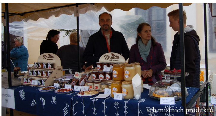
Trh místních produktů