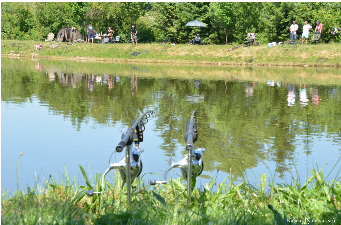
Naše ryby na váš stůl