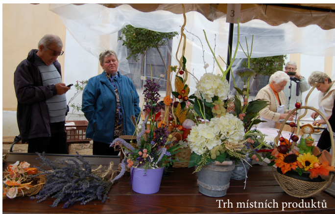
Trh místních produktů