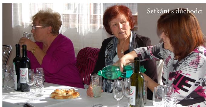
Setkání s důchodci

Letos jsme nevydali stolní ani jiný kalendář. Ale vzhledem k tomu, že se občané po něm ptají, budeme s tiskem kalendáře pro rok následující počítat. Příští rok slavíme 100. výročí vzniku Československé republiky a zároveň 100. výročí vzniku Dechové hudby Skoroňáci, chtěli bychom kalendář zaměřit na tato témata. Za zapůjčení případných vhodných fotografií či historických předmětů předem děkujeme.