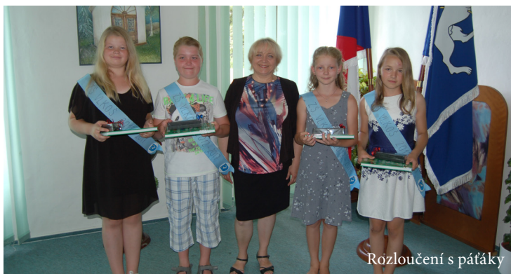
Rozloučení s pátky