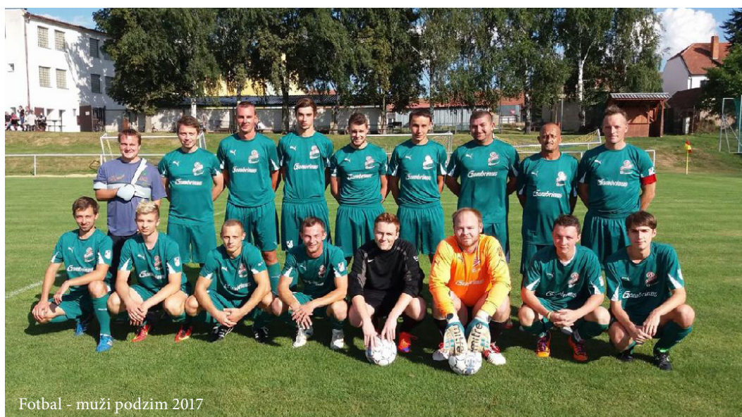
Fotbal - muži podzim 2017