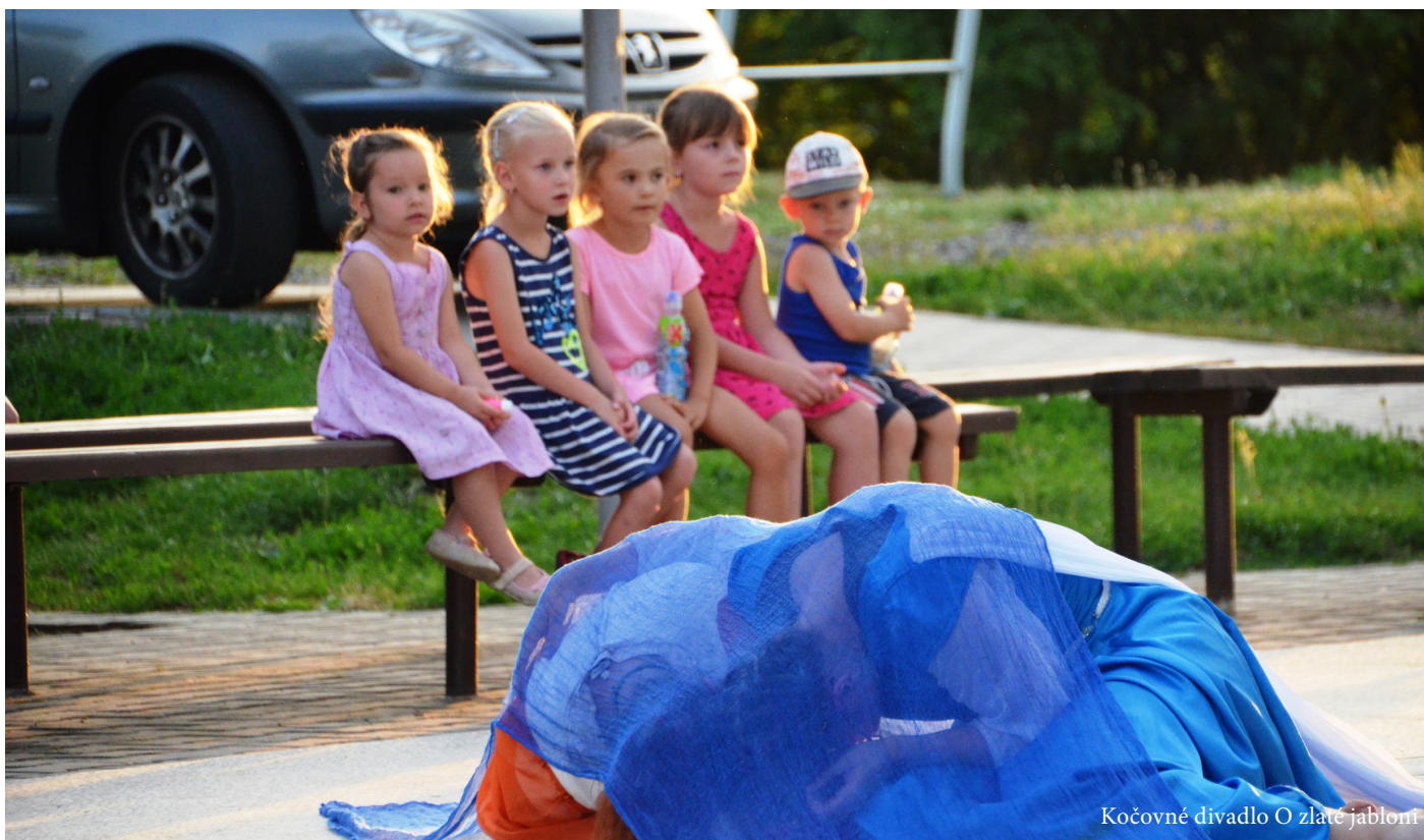
Kočovné divadlo O zlaté jablono