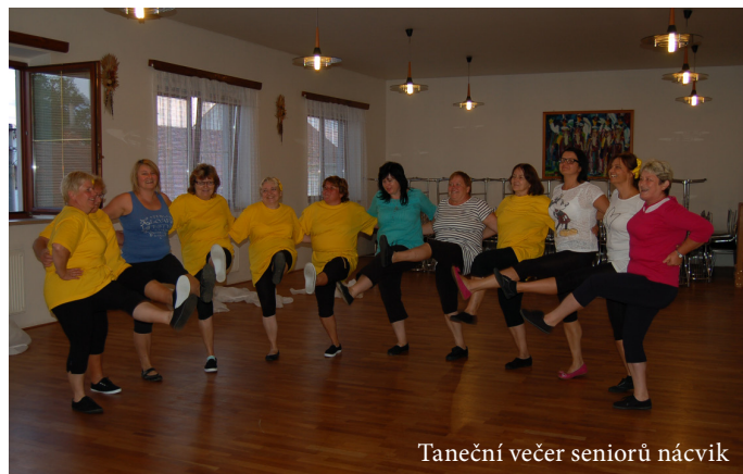
Taneční večer seniorů nácvků