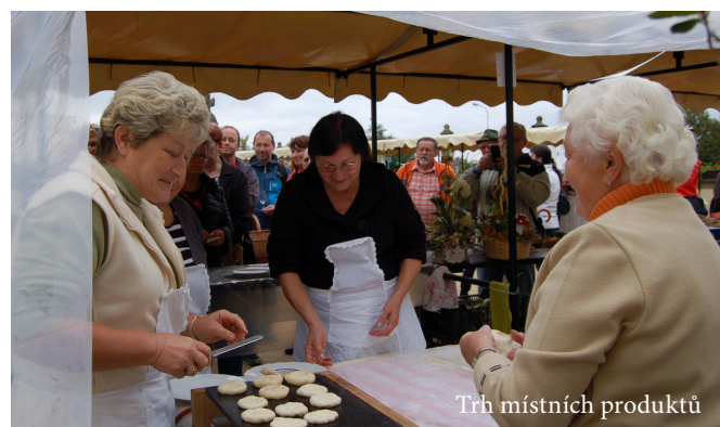
Trh místních produktů