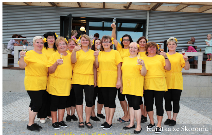
Kurátka ze Skoronic