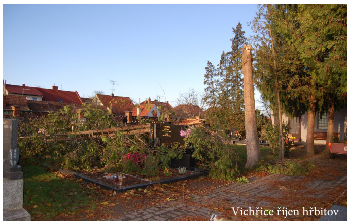
Vichřice říjen hřbitov