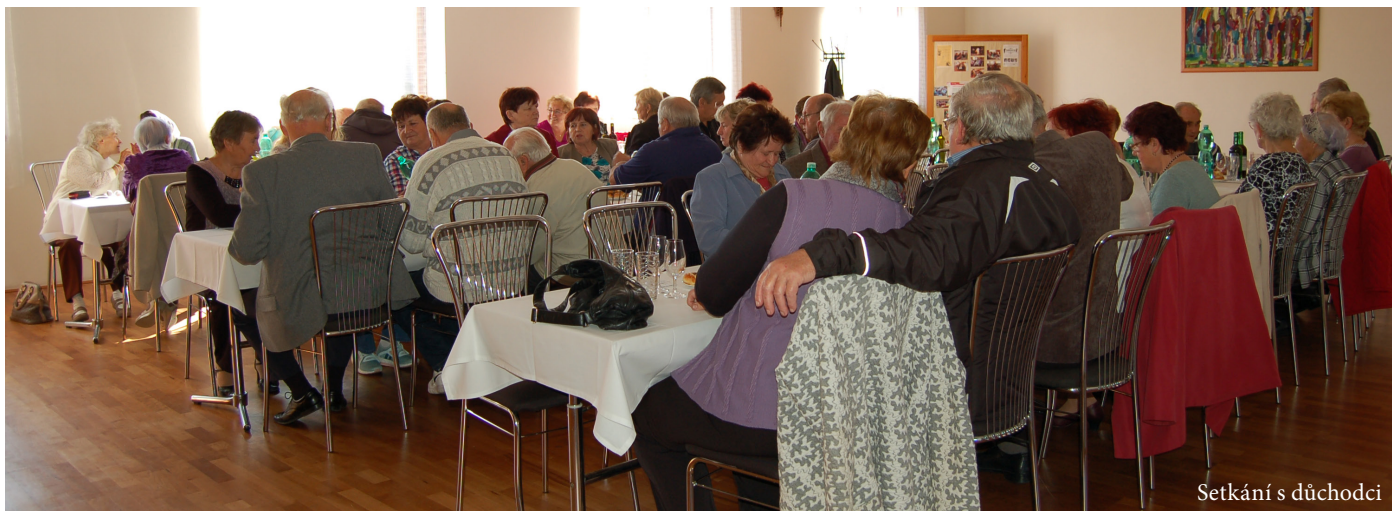
Setkání s důchodci