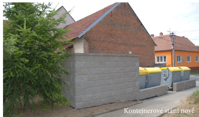
Kontejnerové stání nově