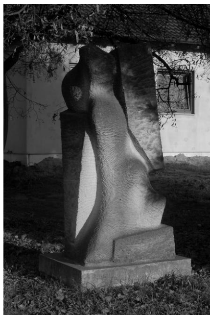
Petr Horák – Fůze účetní cena – 58 000 Kč