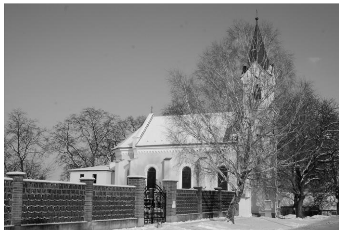
Požehnané Vánoce a nový rok 2013.