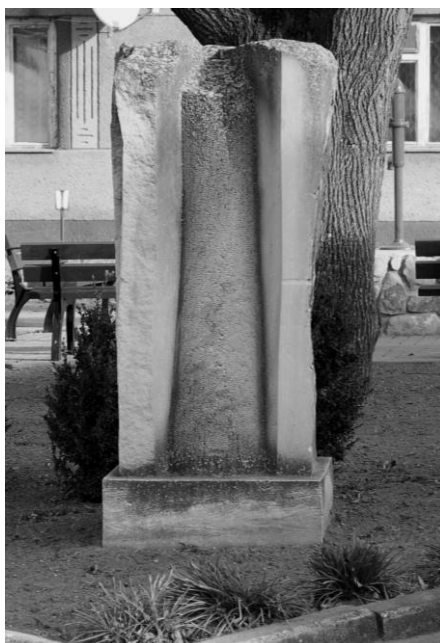
Lubomír Jarcovják – Brána účetní cena – 19 500 Kč