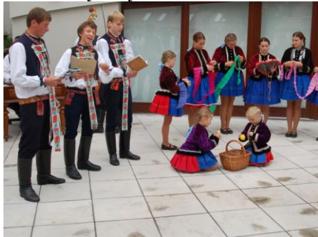
Vernisáž výstavy Jízda králů